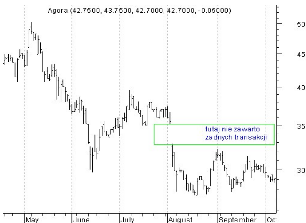
Wykres 2. Kurs akcji spółki AGORA Maj-Wrzesień 2006

Pojęcie ceny nominalnej i emisyjnej oraz zależności między nimi omówimy szerzej przy okazji emisji pierwotnej akcji. Teraz natomiast zastanówmy się czym jest cena rynkowa .