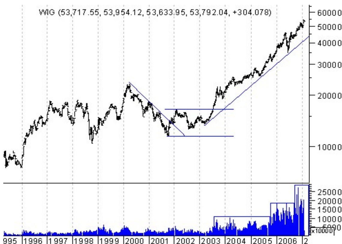
Wykres 3. Indeks WIG z zaznaczonym wolumenem

Obserwacja wolumenu nie może być traktowana jako samodzielny wskaźnik. Jest to raczej wskazówka lub element potwierdzający sygnały płynące z innych narzędzi.